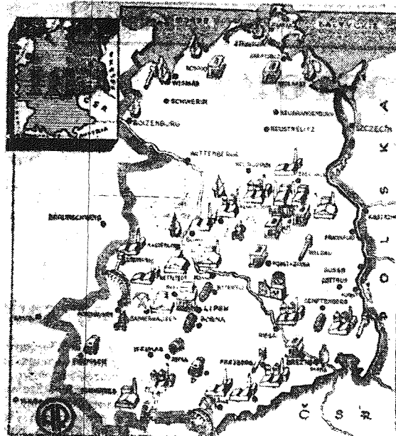
MAPA PRZEDSTAWIA NOWOZBUDOWANE I ODBUDOWANE W NIEMIECKIEJ REPUBLICIE DEMOKRATYCZNEJ ZAKŁADY PRZEMYSŁOWE ORAZ INSTYTUCJE OŚWIATOWE I KULTURALNE.

Rok istnienia Niemieckiej Republiki Demokratycznej był okresem ciężkiej walki narodu niemieckiego przeciw przemocy imperialistycznych okupantów, snujących plany nowej wojny i ich agentom w Bonn. Imperialistom potrzebne są Niemcy, jako baza ataku przeciw Związkowi Radzieckiemu i krajom demokracji ludowej. Dlatego deprecjonując i podważając ich politykę, nie chcąc być połączonymi i pogłębując się do podziemia Niemiec, powzięli oni ostatnio decyzję o wskrzeszeniu hitlerowskiego Wehrmachtu, a zięjący chęcią odwetu tzw. rząd z Bonn przystąpił już do organizowania armii Okupantów zachodni rozpatli równocześnie w Niemczech zachodnich fale terroru wymierzanego przeciw niemieckim bojownikom o pokój. W Triztonii bożkami hulają ekshibiterowcy; Amerykanie wypuszczają na wolność zbrodniarzy wojennych, hitlerowscy sztabowcy funkcjonują oficjalnie jako doradcy amerykańskiej kwatery głównej.