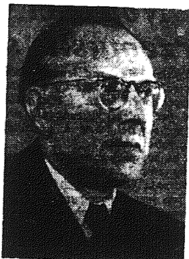
OTTO GROTEWOHL premier rządu Niemieckiej Republiki Demokratycznej.

Niezwykle wielkie znaczenie dla wzrostu mobilizującej siły Niemieckiej Republiki Demokratycznej wśród całego społeczeństwa niemieckiego mają jej wielkie sukcesy gospodarcze. Podczas kiedy ilość bez-