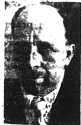
WALTER ULBRICHT premier rządu Niemieckiej Republiki Demokratycznej.

Niemiecka Republika Demokratyczna jest ważnym ogniwem światowego obozu pokoju.