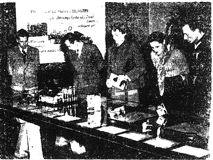
Stoleczny Komitet Radiofonizacji Kraju urządził w sali SRN przy ulicy Chmielnej 7 wystawę radioaparatury i aparatury skonstruowanej przez radioamatorów.

W rozpoczynającym się roku szkolenia partyjnego przed całą partią, przed wszystkimi organizacjami partyjnymi stają nowe, wielkie zadania związane z przygotowaniem aktywów i członków partii do walki o realizację Planu 6-letniego, planu budownictwa podstaw socjalizmu w Polsce.