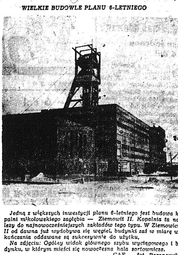
Jedną z większych inwestycji planu 6-letniego jest budowa kopalni m'kolowskiego zagłębia — Ziemowit II. Kopalnia ta należy do najnowocześniejszych zakładów tego typu. W Ziemowicie II od dawna już wydobywa się węgiel, budynki zaś w miarę wykańczania oddawane są sukcesywnie do użytku. Na zdjęciu: Ogólny widok głównego szybu wyciągowego i budynku, w którym mieści się nowoczesna hala sortownicza.

W czasie 3-tygodniowego pobytu w Polsce goście francuscy zwiedzą wielkie budowle socjalizmu oraz zapoznają się z osiągnięciami gospodarczymi i kulturalnymi naszego kraju.