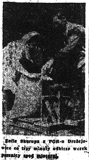
Zofia Skurupa z PGR-u Drożejowice co trzy minuty odbiera worek pszenicy siew jesienną.

W roku przyszłym plony muszą być jeszcze wyższe. Trzeba o około 6 proc. podnieść produkcję 4-ech głównych zbóż w gospodarstwach chłopskich, a w kampanii walki o mięso i tłuszcz zakontraktować 6.800.000 sztuk tuczników. Apel spółdzielców z Kozubowa i pełne wykonanie zobowiązań podjętych w związku z apelem, pozwoli pomyślnie wyrosnąć w trzeci rok budowy podstaw socjalizmu w naszym kraju.