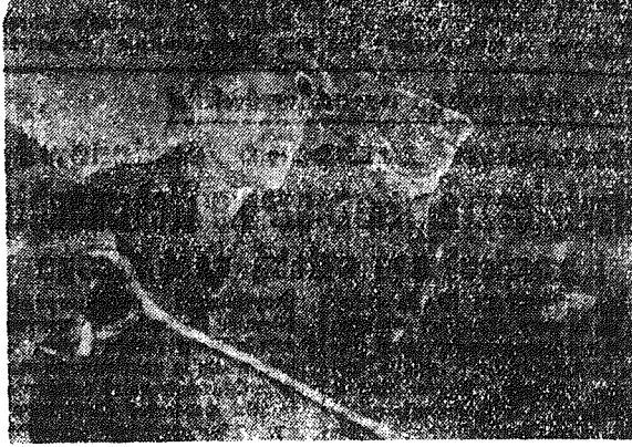
Znany wytapiacz-szybkościowiec Nowotagijskich Zakładów Metalurgicznych, tow. PIOTR BOŁOTOW.