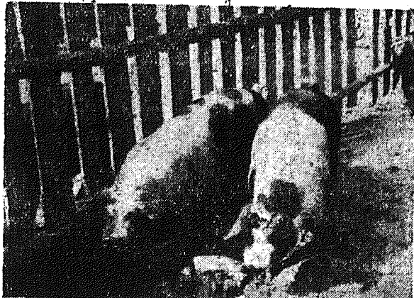
Rośnie mięso dla miast...