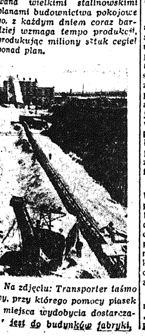
Na zdjęciu: Transporter taśmowy, przy którego pomocy piasek z miejsca wydobywania dostarcza się do budynków fabryki.

Przedstawiciel irańskiego Banku Narodowego w wywiadzie udzielonym korespondentowi dziennika „Journal de Teheran” stwierdził, iż rząd angielski zawsze uprawiał politykę gospodarczego ujarznienia Iranu.