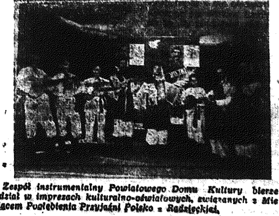
Zespół instrumentalny Powiatowego Domu Kultury bierze udział w imprezach kulturalno-oświatowych, związanych z Miesiącem Przyjaźni Polsko - Radzieckiej.

Należy wierzyć, że wszystkie trudności zostaną przełamane, a artyści - amatorzy w salach szkolnych, remizach strażackich i świetlicach nawet tych najbardziej „nieodłącznych” mieszkańców spotkają się w społeczeństwie Ziemi Sandomierskiej, które nigdy nie zapomni przelanej w walce i wspólnym wrogu krwi żołnierza radzieckiego i braterskiej, wiolecznej pomocy, jaką nam na każdym kroku udziela Kraj Socjalistyczny Socializmu. Ca. M.