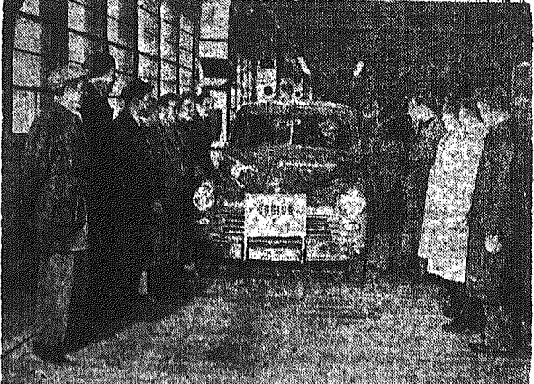
Setny samochód „Warszawa M-20” opuszcza halę montażową Fabryki Samochodów Osobowych na Żeraniu.