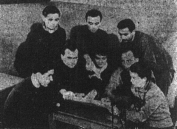
W Gdańsku — Wrzeszczu trwa obóz przygotowawczy czołowych zawodników tenisa stołowego, którzy będą reprezentowali Polskę w meczu z NRD.