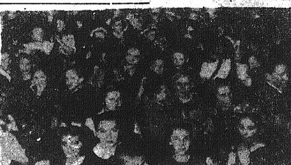
Komitet Rodzicielski przy szkole podstawowej Nr 3 w Kielcach zorganizował w ubiegłą niedzielę w sali ZZK zabawę dla dzieci.

Wesoło i przyjemnie spędziły dzieci czas na tańcach, zabawie oraz przy słodkiej kolacji.