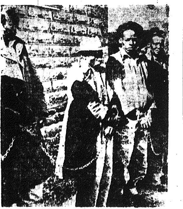
Na zdjęciu: Skuci łańcucha mi, aresztowani bojownicy o wolność Kenii.

ków plemienia Kikuyu, który usiłował uciec. Agencja Reutersa donosi, iż w okręgu Nyeri ma nastąpić największa z dotychczasowych akcji przeciwko plemieniu Kikuyu. W tej nowej akcji mają wziąć udział oddziały wojska i policji brytyjskiej oraz wozy pancerne i artyleria.