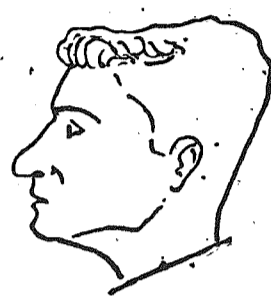
Mistrz narciarski województwa w skokach STARZYŃSKI