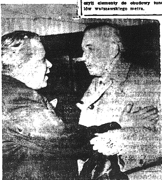
Na zdjęciu: serdeczne przywitanie pisarza Iłji Erenburga (ZSRR) z Nicolas Guillen, poetą z Kuby.

Dokumentacja techniczna dla zakładów w Nowej Soli opracowana została w oparciu o wzory produkującej techniki radzieckiej. Wiele form, a m. in. najnowsze maszyny, armatury, narzędzia dostarczył przemysł NRD. Pozostałe urządzenia wyprodukują przemysł krajowy.