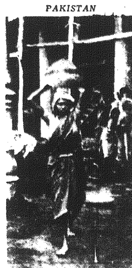
PAKISTAN. Kobiety w Pakistanie stanowią najniższą siłą roboczą. Na zdjęciu: Kobieta zatrudniona w budownictwie niesie zaprawę murarską.