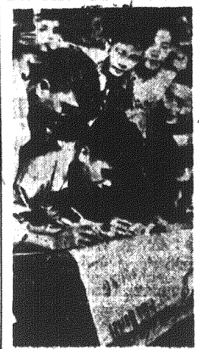
Młodzież wietnamska nie zaprzestaje walki o pokój. Na zdjęciu: Młodzież z Ho-Binh składają swe podpisy pod apelem o zawarcie Paktu Pokoju.

pel do młodzieży Holandii, wyrażając do aktywnego udziału w przygotowaniach do zbliżającej się międzynarodowej konferencji, która będzie obradowała w marcu r.b. w Wiedniu.