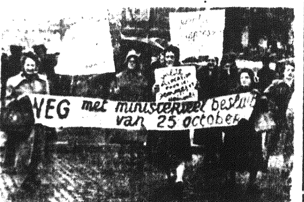
Polityka przygotowań wojennych prowadzona przez rząd belgijski jest przyczyną katastrofalnej sytuacji szulata pracy. Na zdjęciu: Demonstracja kobiet na ulicach Brukseli.