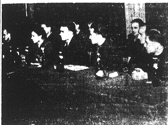
W przedmowa Zlotu zasiadli przedstawiciele partii, Zarządu Wojewódzkiego ZMP oraz czołowi przewodnicy pracy okręgu kieleckiego.

lała się nasza najodważniejsza i najbardziej ofiarna młodzież. Dyskusjanci dużo mówili o tym, jak brygady szturmowe walczą o plan i jakie osiągają sukcesy.