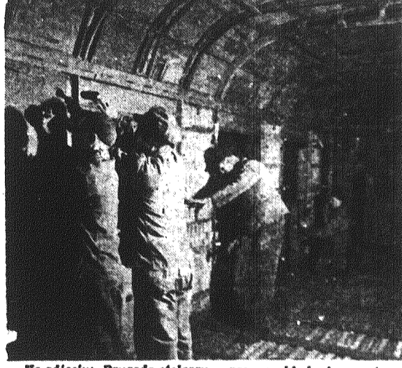
Na zdjęciu: Brygada stolarzy przy wykładaniu wnętrza wagonu osobowego izolatorem.