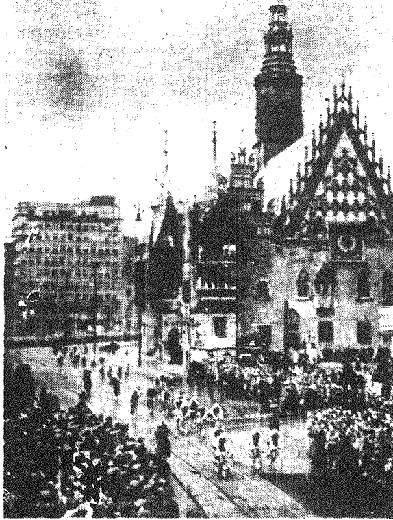
Na zdjęciu: Kolarze przejeżdżają przez przastary gród plastowski — WROCLAW.