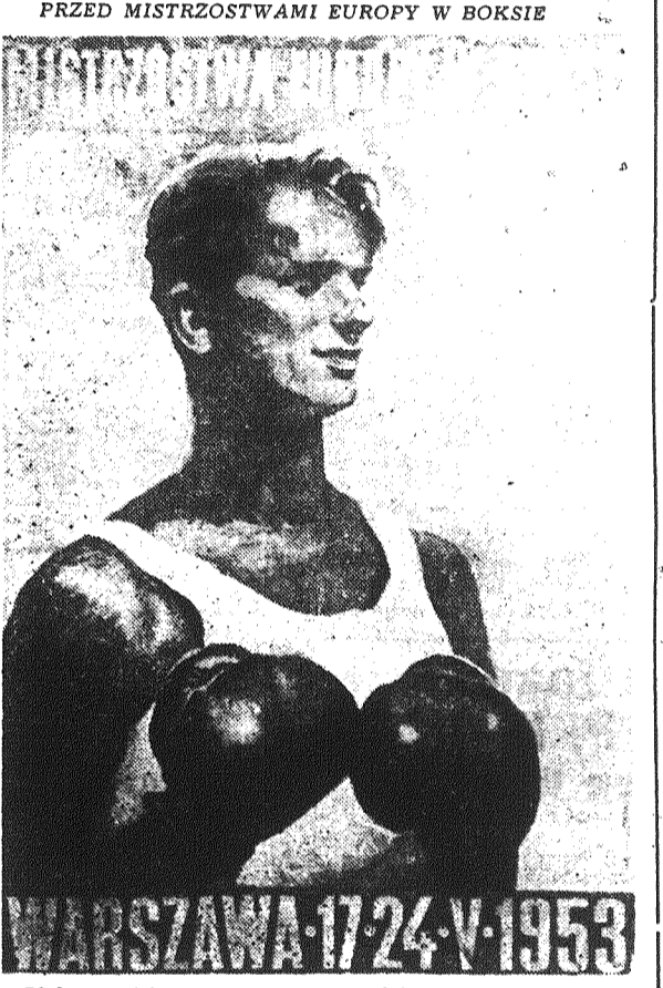
Plakat projektował Lucjan Jagodziński

W drużynie Włókniarza na pochwałę zasługuje prawa strona ataku Jezierski - Piłarski oraz Urban w pomocy i Baran na obronie.