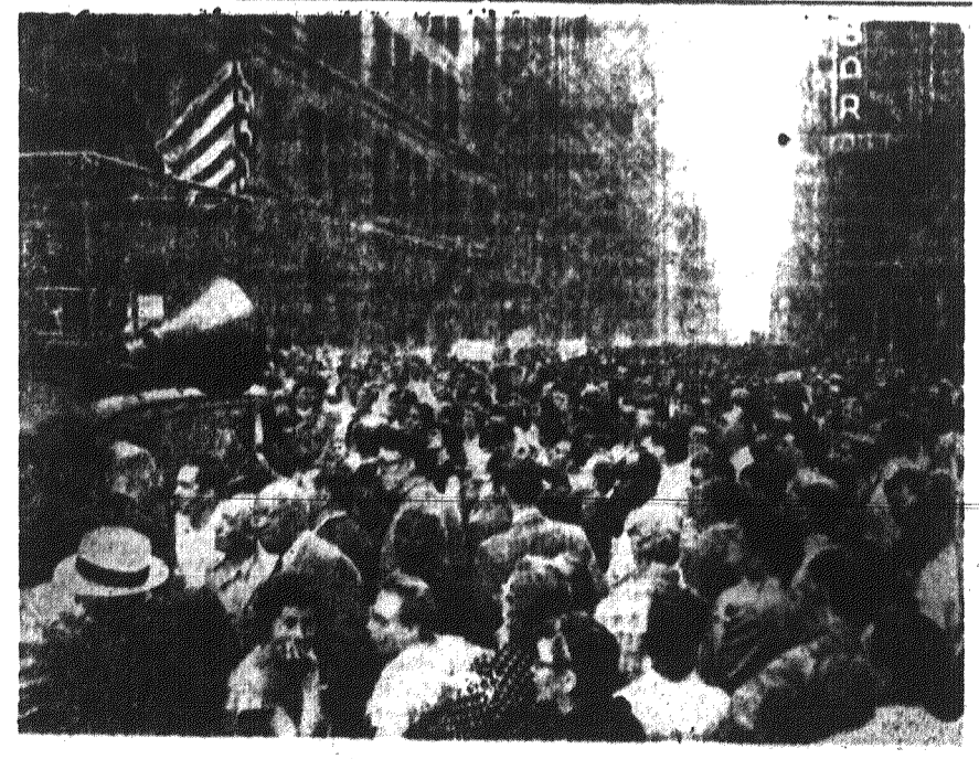
Na zdjęciu: Fragment potężnej demonstracji na 20-tej ulicy w Nowym Jorku przeciwko szkodliwej na Rosenberga.