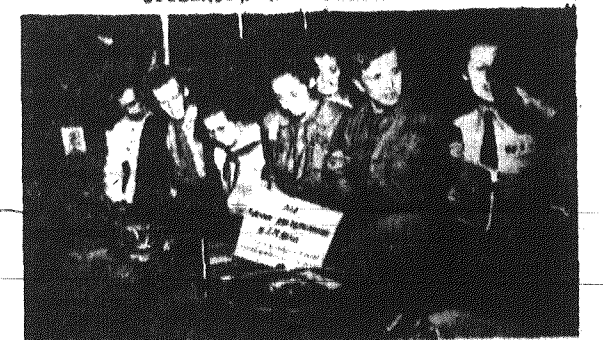
Młodzież miast i wsi - ZMP-owcy i młodzież niesorganizowana, pragnąc dać wyraz solidarności z walką młodzieży świata o pokój, świętują młode pokolenie, przygotowuje liście podarki dla swych zagranicznych przyjaciół, którzy wamnia udział w IV Światowym Festiwalu Młodzieży i Studentów w Bukareszcie.