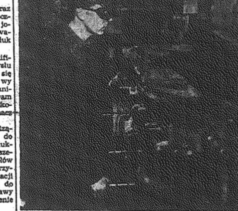
Wzrost wymiana towarowa między Polską a ZSRR