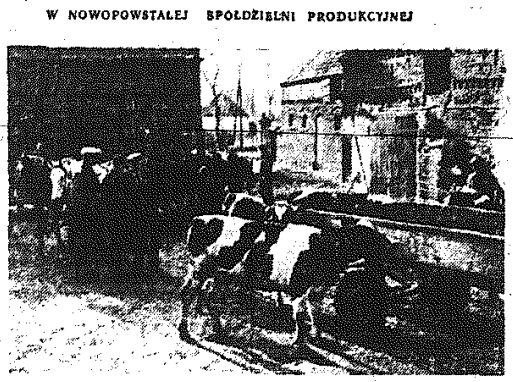
W okresie przedzjazdowym w powiecie gnieźnieńskim (woj. poznańskie) ilość spółdzielni produkcyjnych wzrosła z 59 do 93. Między innymi powstała spółdzielnia produkcyjna w gromadzie Obrza...

Był w historii „Kamiennej” okres, w którym nie wykonywała ona planów produkcyjnych, a więc nie realizowała w pełni zadań jakie przed wszystkim zakładami przemysłowymi postawiła partia, rząd i cały naród.