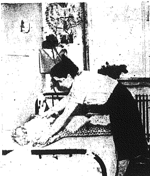
Duże osiągnięcia posiada Dom Młodzieńca Robotnika im. Hanki Sawickiej. W Łodzi zamieszkały przez młode robotnice z ZPB im. J. Marchewskiego, ZPB im. J. Stalina oraz ZPB im. Harnasza. Wielu ostatecznie kilku mieszky wiele zrobiono w dziedzinie podniecia estetycznego wyglądu domu i kultury mieszkaniowej. D. M. R. ma własny 36-osobowy chór. Do kół Wesołochy Radowej należy 70 robotnic, zaś do szkoły czynnej na terenie domu uczęszcza około 90 dziewcząt. Powstała filia mieszkanek domu — to przedsiwzięcie pracy.

Cenne zobowiązania pierwszomajowe podjęła załoga Ostrowieckich Zakładów Materiałów Ogniotrwalskich. Robotnicy formowni maszynowej dadzą w kwietniu ponad plan 175 ton półfabrykatów. Robotnicy pieców — 150 ton wyrobów gotowych, a załoga rozrabialni — 48 ton.