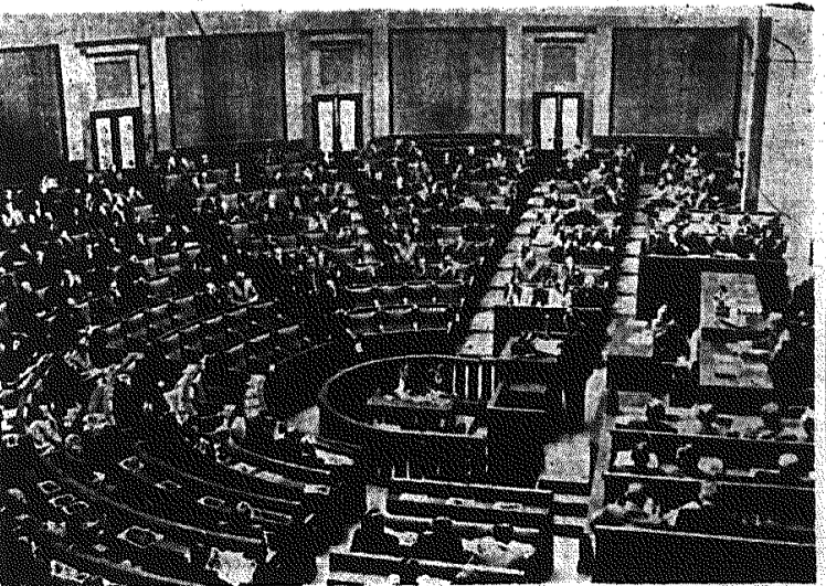
Na zdjęciu: Ogólny widok sali obrad Sejmu PRL.