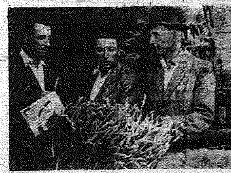
Chłopcy oglądają okazy prezentów.