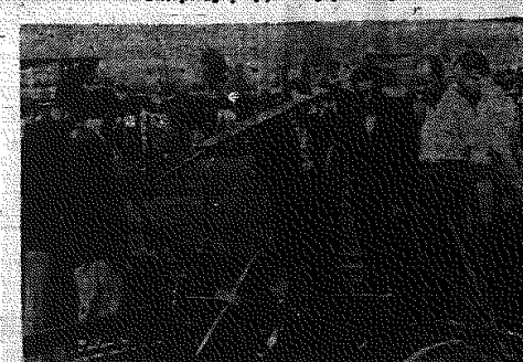
Zwiedzający Wystawę z zainteresowaniem oglądali maszyny rolnicze.