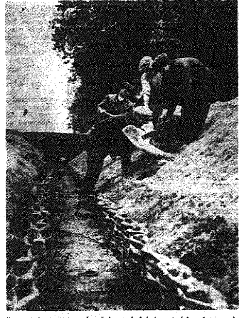
Zagospodarowanie odwodnionych łąk i pastwisk połączone jest z melioracją wodną...