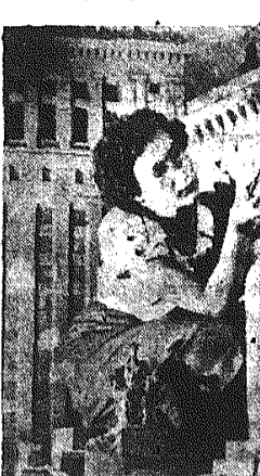
Radziecy artyści w pracowniach...