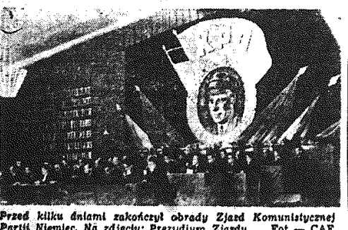
Przed kilku dniami zakończył obrady Zjazd Komunistycznej Partii Niemiec. Na zdjęciu: Prezydium Zjazdu.

w jakiej znajduje się naród włoski, jak również wszystkie narody Europy, zobowiązuje całą partię, by prowadziła walkę z nową energią, by powstrzymała rękę tych, którzy przygotowują nowy straszliwy konflikt.