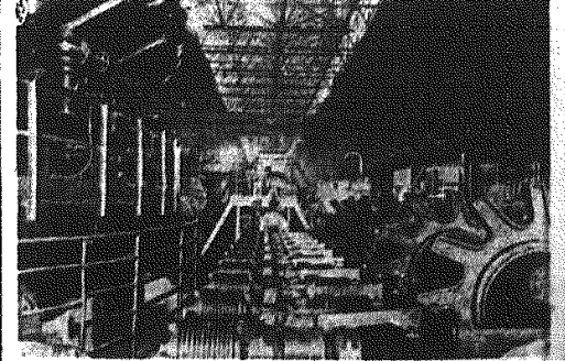
Fabryka rur w Piernoursku (obwód Suterdiński) wyposażona jest w nowoczesne maszyny automatyczne. Na zdjęciu: Wanna automatyczna do chłodzenia zwozów walcarki.