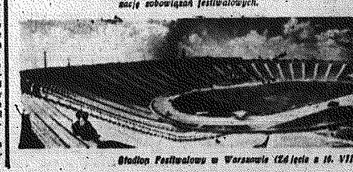
Student Festiwalowy w Warszawie (14 lipca o 16. VII. 1955 r.)