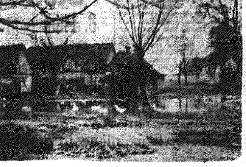
Fragment Brzozowej...

Kula wstąpił w czasie okupacji do Polskiej Partii Robotniczej, patała także do Gwardii Ludowej. Oweznna świadomość polityczna Kuli nie obejmowała konkretnie i szeroko przysiętej polskiej państwowości. Kula wiedział, że Polska będzie! Inna niż była. Łączył z nią jedynie przymiot niki! Lepsza, sprawiedliwa, ludowa. Na dobrą sprawę wystarczała mu wtedy skromniuka wiedza o przyszłej ojczyźnie. Tak bowiem najogólniej zarysowana Polska powojenna można było wypełnić dowolnie wymarzonymi szczegółami. A więc — gdy skończył się wojna Kula obmyślił jakieś nieopóźnione stano wisko, przyjdzie kres niebezpieczeństwom i trudom, bo odebrało słonie brzozowskiemu dzielnictwu Witkowskiemu i dano jego ratujom, łpiza — choćby dlatego, że ludowa i sprawiedliwa. Ale Kula zbyt dostrzegł, że owe trzy fundamentalne cechy nie wykluczają trudów, ciężkiej pracy, grozy niebezpieczeństw. To go odrobinnę rozczarowało — inne były jego miraża. Kula nie pojął także, że jego starego