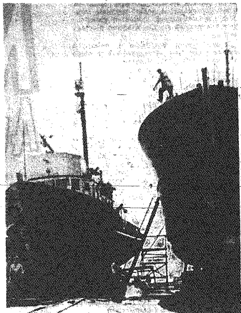
Baza remontowa w porcie Burgas