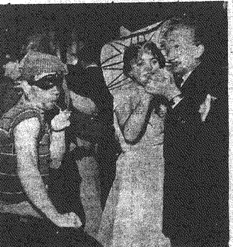
Kostiumowy Bal Prasy, jaki odbył się w ubiegłą sobotę w „Zróżdowej”, był imprezą nader udaną. Humor i kostiumy (patrz zdjęcie) dopisywały. O szczegółach napiszemy w sobotnim numerze „Słowa Tygodnia”.