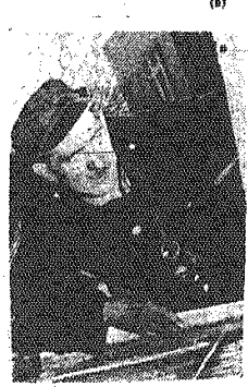
...w drodze do góry...

blacha nie wytrzyma ciężaru człowieka. Zajął się pracownik Powiatowej Wlebobranowej Spółdzielni Pracy, do której należy 16-osobowy oddział kominarski dla Kielca. Za — podczas gdy w kieleckich miastach kominy czyszczy się nie wychodząc na dach, bo na szychu są odpowiedzialni drzewi kominowe — u nas nowe budownictwo nie dość, że „uczadza” (chcąc być w zgodzie), o szczednościowych za wąskie kominy, które szybciej się zanieczyszczają, to często oddaje do użytku budynek nawet bez wyjścia na dach.