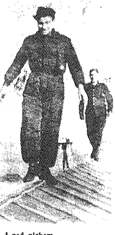
I pod niebem.

Ważnym zjawiskiem Wielu głośno: Zakłady Metalowe im. „Waltera” w Radomiu otwierają własny sklep, w którym rzemieślnicy mogą zakupić odpady nadające się do produkcji, znaleźć wiele innych związanych z rzemiosłem towarów. Pomysł bardzo dobry. Zakłady sprzedają wartościowe a nie wykorzystywane należyte półprodukty, rośnie ich zysk z korzyścią dla całego rzemiosła, który „możni uchodzą” za surowcem mogą się zaspokajać na miejscu. Korzyść niewątpliwa i obopólna.