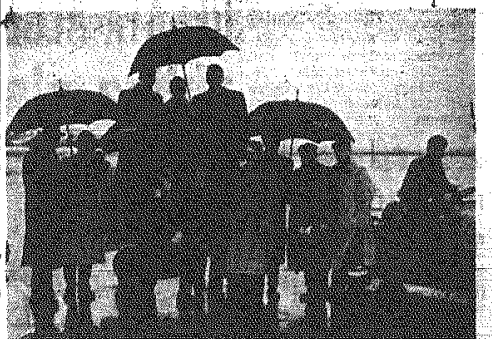
Na zdjęciu: „Warszawska” pogoda powitała reprezentację polskich bokserów w Düsseldorfie. Pogoda na szczęście nie miała wpływu na formę naszych zawodników...