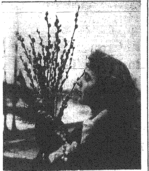
Wierzby nad Odrą pokryły się baziami. Na zdjęciu: wrocławianka z gałązkami wierzby.