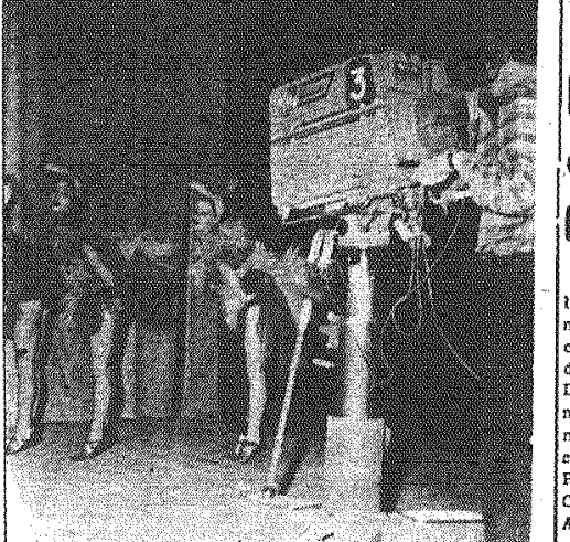
Poznań otrzymał stację telewizyjną. Na zdjęciu: Studio w czasie nadawania anteny telewizyjnej.