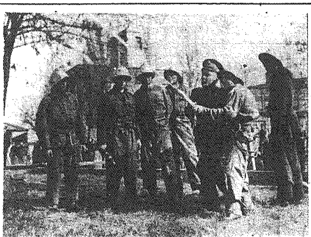
Istniejąca od 2 miesięcy drużyna harcerska przy Zakładach Ochrony w Radomiu składa się z kilkunastu praktykantów...