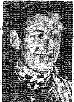
Zwycięzca VI etapu Kolarskiego Wyciągu Pokoju Vladimír Růžicka (CSR).