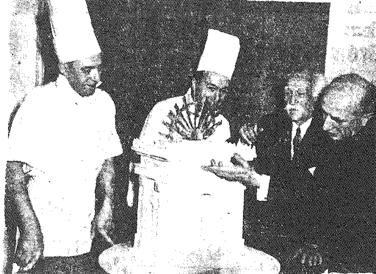
Fot. — CAF

Na pokazie gastronomicznym w Pałacu Zamojskim m. in. ministrowy „Luk Trębaczowski”, wykonany z cukru. CAF