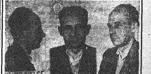
Opracował M. Preis Tadeusz Wiało

— Dla siebie, czy dla Szlezyngiera? — Dla Szlezyngiera, który szwagrowi dał za to swoją łapówkę. (d. c. n.)