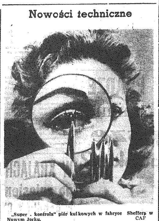
„Super - kontrola” piór kulkowych w fabryce Sheffers w Nowym Jorku.

WASZYNGTON PAP. Senator z ramienia partii demokratycznej A. J. Ellender oświadczył w niedzielę, że St. Zjednoczone powinny rozważyć sprawę złagodzenia obowiązującego w USA embargo na handel z Chinami. Ellender oznajmił w wywiadzie telewizyjnym, że jego zdaniem — w związku z brytyjską decyzją o zmniejszeniu ograniczeń eksportowych w handlu z ChRL rząd USA „powinien dokonać gruntownej rewizji swego stanowiska”. Skoro kraje Europy zachodniej — powiedział Ellender — zamierzają rozszerzyć wymianę towarową z Chinami, to należałoby się zastanowić „nad możliwością sprzedawania Chinom Ludowym niektórych naszych materiałów niestrategicznych”. (AR). Złagodzenie przez W. Brytanię ograniczeń w handlu z Chinami wywołało swego czasu „rewolucję” na Zachodzie. Sedno sprawy w tym, że możliwości otwierające się obecnie przed angielskimi eksporterami na