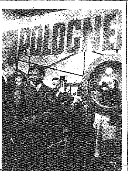
Na Targach paryskich. Na zdjęciu: Minister handlu zagranicznego W. Trąmpczyński zwiędza pawilon polski.

Przedłużająca się debata nad tym projektem opóźnia podpisanie końcowych dokumentów układu polsko-amerykańskiego, którego tekst został uzgodniony w czasie toczących się od szeregu tygodni w Waszyngtonie rozmów między delegacjami gospodarczymi obu krajów.