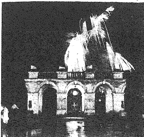
Najbardziej chyba atrakcyjnym punktem programu imprez rozrywkowych z okazji Święta Wyzwolenia były pokazy sztucznych ogni w Ogródku Saskim. Na zdjęciu: widok na Grób Nieznanego Żołnierza. CAF — fot. Dąbrowski