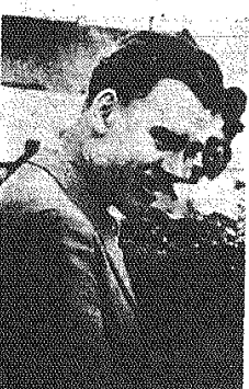
Statutek owacyjnie wita przez młodzież wjeżdża na Rynek w Jędrzejowie