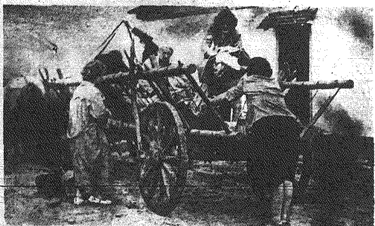
Mimo że w wielu okolicach Polski żniwa zostały już zakończone...