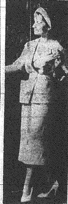
Na zdjęciu: Model NRD — modna „garsonka” na codzień.

Omawiana uchwała w wyniku postanowień Rady Ministrów i Komitetu Ekonomicznego, 12 plany i budżety rad narodowych powinny być uchwalane przez nie przed po-