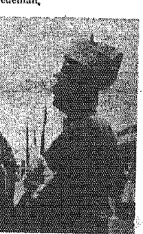
Na sali obrad XII Plenum CRZZ.