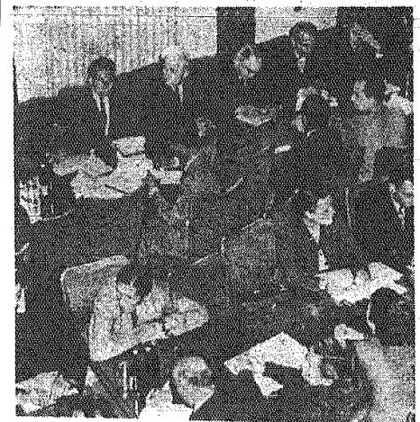
Na sali obrad XII Plenum CRZZ.

PANIETAJ Już w niedzielę, 29 września br. odbędzie się kolejne losowanie „Przeplóreczki“ Nie zapomnij zdać kuponu. Ostatni dzień przyjmowania kuponów miało w Kielcach w piątek, a w innych miejscowościach naszego województwa w czwartek bieżącego tygodnia. MOŻE TOBIE PRZYPADNIE GŁÓWNA WYGRANA? 1059-K