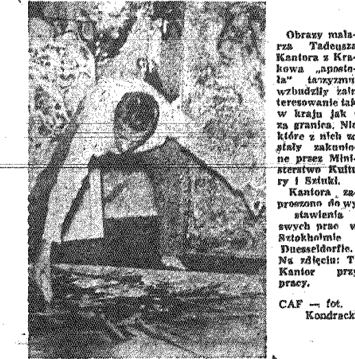
Obrazy malarsza Tadeusza Kantora z Krakowa „apostola” — „apostola” — „apostola”, wzbudziły żal i zainteresowanie tak w kraju jak i za granicą. Niektóre z nich to stały zakazane przez Ministerstwo Kultury i Sztuki. Kantora, zaproszony do wystawienia swych prac w Stokholmie i Dusseldorfie. Na zdjęciu: T. Kantor przy pracy.

Pod hasłem utrwalenia i promian, zmierzających do demokratyzacji życia wyższych uczelni i stałego podnoszenia poziomu ich pracy naukowej — dydaktycznej i wychowawczej — rozpoczął się 1 bm. nowy rok akademicki. Ponad 100 tys. młodzieży przystępuje do nauki na uniwersytetach i politechnikach, w wyższych szkołach rolniczych i pedagogicznych, akademiach medycznych, akademiach wychowania fizycznego, uczelniach artystycznych i wojskowych. Podczas uroczystości inauguracyjnych nowy rok akademicki wielu zaufanych pracowników nauki otrzymało wysokie odznaczenia państwowe.