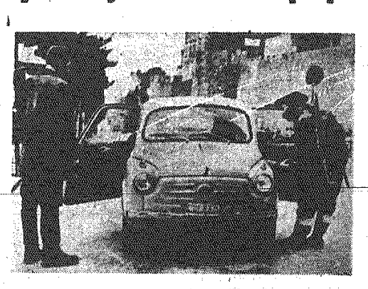
Na zdjęciu: patrol milicji Indowej kontroluje samochody wjeżdżające na terytorium Republiki.

REYM PAP. Żandarmeria nielegalnego rządu antykomunistycznego w San Marino ażyje sobie nowe uniformy u krawców włoskich. Fakt ten — jak podaje agencja Reutersa — nie pozostaje bez znaczenia dla taktyki nielegalnego rządu, który chce zdobyć sobie popularność wśród mieszkańców Republiki dzięki zastosowaniu tak zwanej „pokojujowej perwazji”.