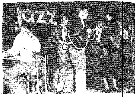
Gra, Czterolista koncertynka