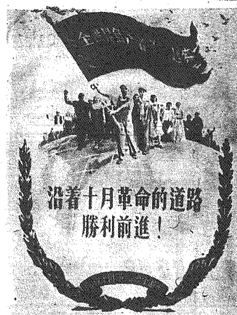
Plakat chiński projektu Czuu Ling-csao. Napis na czerwonym sztandarze: „Proletariusze wszystkich krajów łączcie się”.