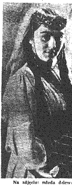
Na zdjęciu: młoda dziewczyna gruzińska.