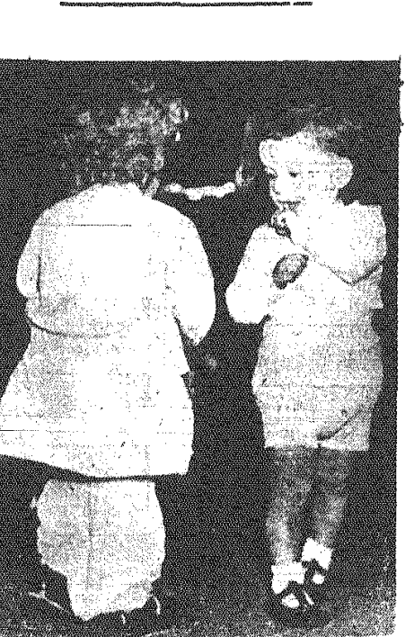
Mimo zdziwionego męskiego spojrzenia ta młodociana uczestniczka dziecięcego pokazu mody w Londynie nie straciła simnej krwi.

Do sapsachu podobno można ANDRZEJ MALINOWSKI