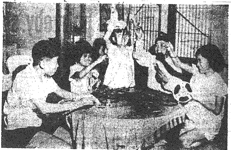
W Tokio i innych miastach japońskich powstały dziecięce zespoły filmowe. Na zdjęciu widzimy kilku członków takiego zespołu, który sfilmował starą legendę japońską.