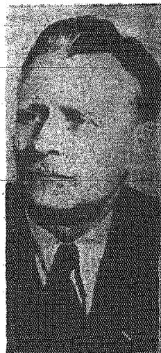
Nowy prezydent Republiki Czechosłowackiej — Antonín Novotný.

Antonín Novotný urodził się 10 grudnia 1904 r. w Letnaniach w pobliżu Pragi w rodzinie robotniczej. Zdobył on kwalifikacje ślusarsza i jako robotnik pracował w różnych zakładach przemysłowych.