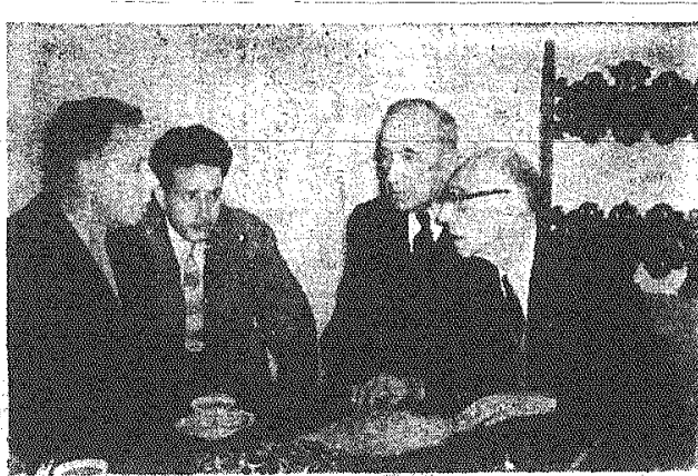
Spotkanie liderów radzieckich i polskich

przeleżała kole, jest znacznie mniejsza od tej, która planowana do przewiezienia przed rozpoczęciem przewozów jesiennych. Wiąże się to najprawdopodobniej z mniejszym, niż w roku ubiegłym urodzajem na ziemniaki.