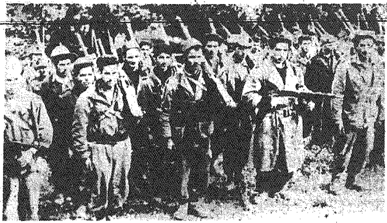
Na zdjęciu: Grupa patriotów algerskich.