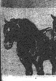
Studium - akwarela.