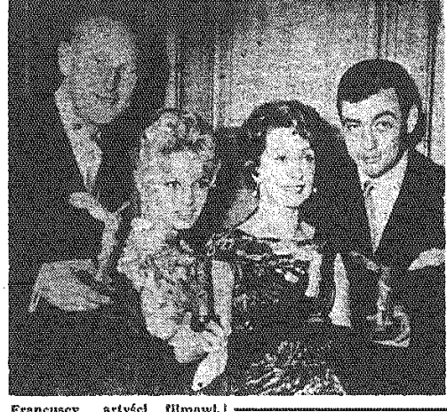
Francuscy artyści filmowi, którzy otrzymali tegoroczną nagrodę za najlepszą interpretację. Od lewej: Bourvil, Brigitte Bardot, Danielle Darrieux i Francois Perier.

Ostatnio obradowało Prezydium Rady Robotniczej ostrowskiej huty. Omawiano sprawy związane z bieżącą realizacją zadań produkcyjnych.