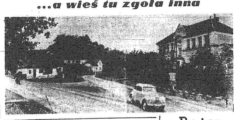
...a wieś tu zgoła inna

Na 20 dni przed terminem zrealizowała swoje zadania zakładowa Włostów kolo Opawy. Miała ona z tegorocznej kampanii wyprodukować 5.600 ton cukru.