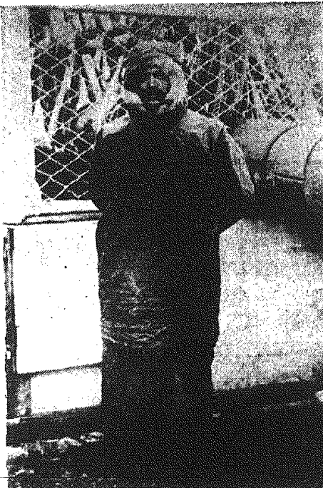
85-letni Olav Bjaaland na pokładzie polarnego statku „Fram”, w drodze na Antarktydę.