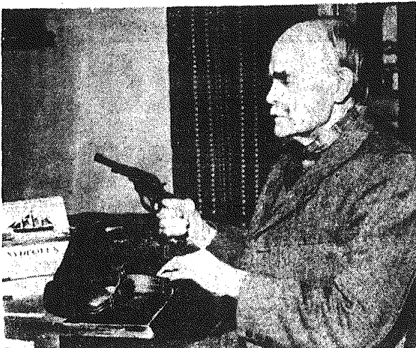
Oto stary pistolet (prezent od Amundsena), który służył do zabijania fok i psów, padających z wyczerpania podczas wyprawy.