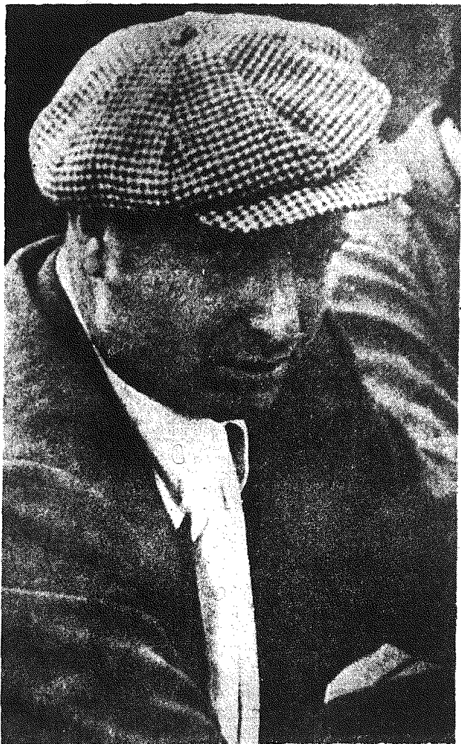
46-letni Argentyńczyk, automobilowy mistrz świata klasyfikowany na 3 miejscu (za Kucem i Gutowskim) na liście 10 najlepszych w świecie sportowców roku 1957...