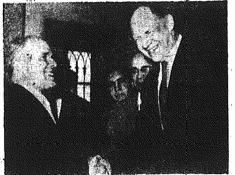
Prezydent Tunisu — Bourguiba (po lewej) w towarzystwie amerykańskiego podsekretarza stanu Roberta Murphy'ego w pałacu rządowym w Tunisie.

Echa prasy zagranicznej na temat nowej propozycji ZSRR dotyczącej zwołania konferencji na najwyższym szczeblu — zamieszczamy na str. 2.