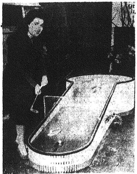
Na zdjęciu: dla amatorów golfa - sporządzone z plastiku miniaturowe pole golfowe.