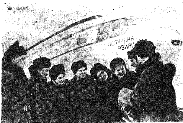
Z Moskwy wyleciała na tereny arktyczne grupa artystów moskiewskich. Wystąpił on przed badaczami okolice podbiegunowych.