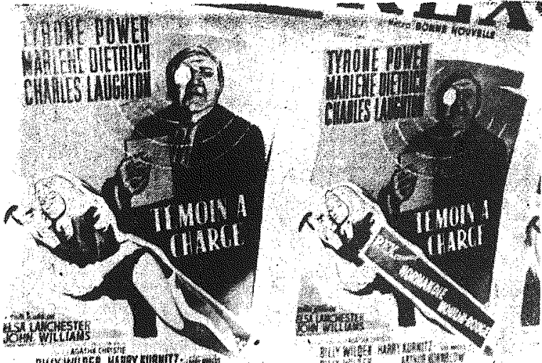
Radni miasta Paryża - wskutek protestów od rozmaitych stowarzyszeń...