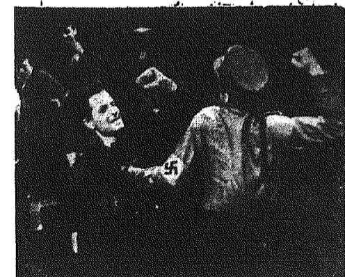
W Wytwórni Filmów Fabularnych w Łodzi trwa realizacja nowego polskiego filmu pt. „Pocztą Gdańską“, którego treścią są dramatyczne przeżycia garstki obrodców tej placówki we wrześniu 1939 r. Na zdjęciu: w knajpie portowej.