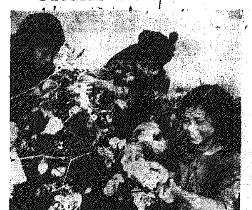
Dziewczęta przy zbiorze bawełny w Państwowym Gospodarstwie Rolnym.

na brak miejsca w dzisiejszym numerze - tekst przemówienia W. Wachowicza zamieścimy jutro.