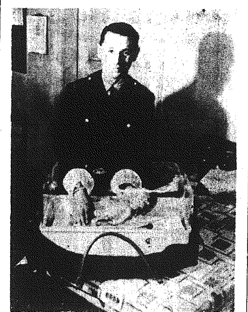
Straż pożarna w Bonn otrzymała do dyspozycji inkubatory dla wczesniaków. Na wszelki wypadek. Np. pożar w kuchni w domach, gdzie są niemowlęta...