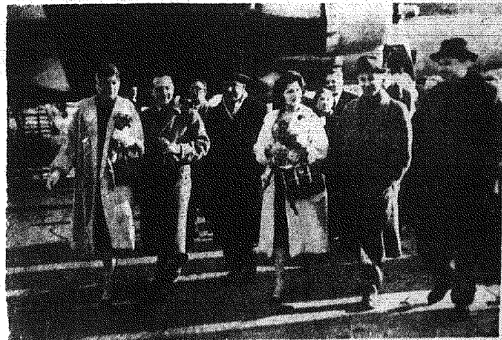
24 marca 1958 r. przybyła do Warszawy na przegląd filmów włoskich delegacja Kinematografii włoskiej. Na zdjęciu: powitanie na lotnisku Okęcie.

W Warszawie rozpoczął się przegląd filmów włoskich. Przed rozpoczęciem przeglądu w śródmieściu Warszawy, przed Pałacem Kultury, przy skrzyżowaniu Al. Jerozolimskich i Nowego Świata zorganizowano wystawę barwnych włoskich fotografii i plakatów filmowych przedstawiających wybitnych artystów i reżyserów.