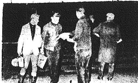
W ostatnich dniach członkowie sdelegatowanej KP D kolportowali w Hamburgu ulotki przeciwko wojnie atomowej. Ulotki wzywają robotników, przede wszystkim robotników portowych i stoczni, do czynnego przeciwstawienia się zbrojeniom atomowym. Na zdjęciu: robotnicy rozdają ulotki na terenie portu w Hamburgu.