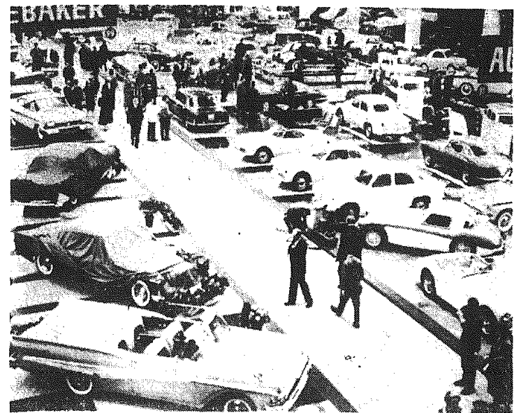
Z międzynarodowego salonu samochodowego w Genewie. Ogólny widok.