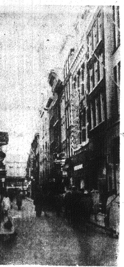
Jedna z wąskich uliczek starego Amsterdamu.