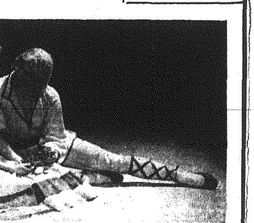
Fot. Edward Hartwig