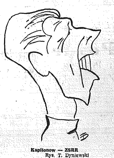
Kapitonow - ZSRR Rys. T. Dynlewski

MOSKWA. Grupa okrętów jugosłowiańskich pod dowództwem kontradmirała Pesoticia złoży rewizytę flocie czarnomorskiej. W najbliższym czasie nastąpi od dawna oczekiwana przez szerokie rzesze nauczycielstwa reorganizacja administracji szkolnej. Sprawa ta dotycząca się ostatecznego rozwiązania w rozporządzeniu Rady Ministrów z 18 kwietnia br. powołujemy w miejsce dotychczasowych wojewódzkich wydziałów oświaty i dyrektoriów okręgowych szkoleń zawodowego kuratorium okręgowych szkół. W miejsce powiatowych wydziałów oświaty i inspektoratów oświaty.