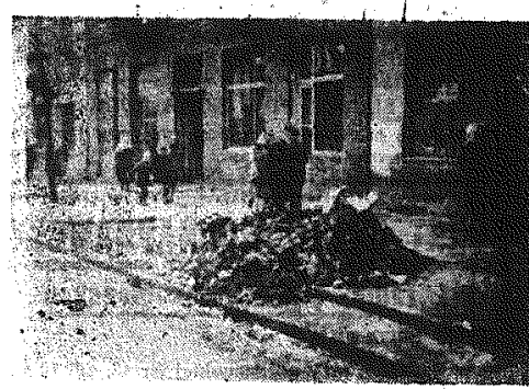
Orh, jak pięknie. Od razu widać, że to przynajmniej ulica.