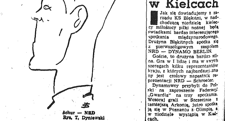
Schur — NRD Rys. T. Dymowski

Zatrzymany jest od dawna poszukiwanym przez wrocławską MO złodziejem. Legitymowany przez milicjantów usiłował udawać cudzoziemca, jednakże nie znał żadnego z języków obcych. Oszust został osadzony w areszcie. Śledztwo niewątpliwie wyjaśni w jaki sposób zdobył odznakę uczestnictwa i czapkę kolejarza.