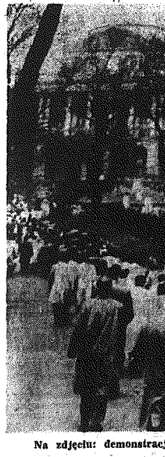
Na zdjęciu: demonstracja bezrobotnych w Bostonie.