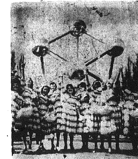
Na zdjęciu: holenderskie dziewczęta przyniosły ze sobą na wystawę tonkile i tulipany...