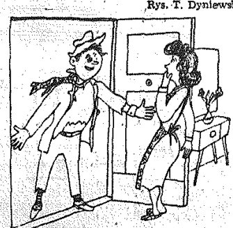
— Kochanie, musiałem zobaczyć Wyścig Pokoju.