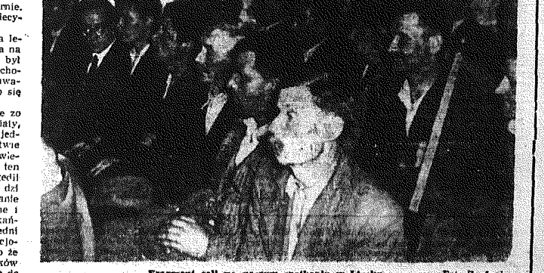
Fragment sali na naszym spotkaniu w Lipsku.