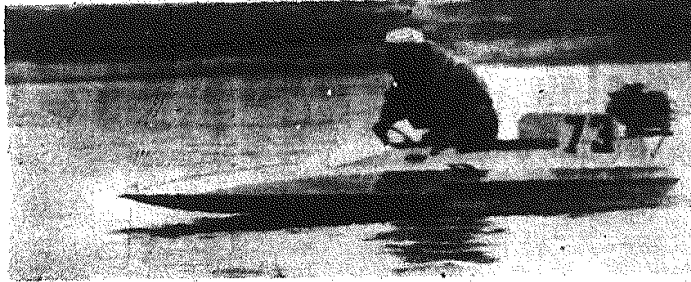
Na zdjęciu: Bułanowicz (Polska) zwycięzca w klasie B (350 cm 3 ).