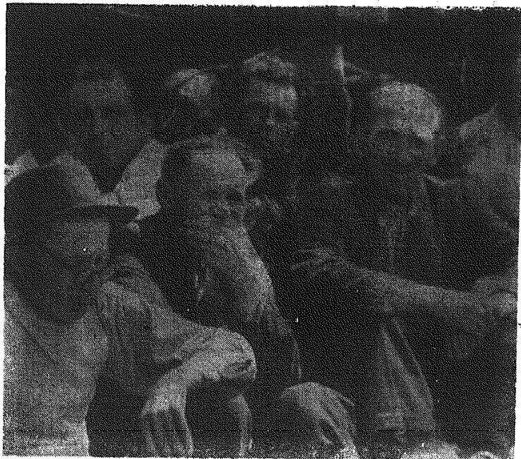
Liczne zgromadzenia chłopów z uwagą słuchali wygłoszonych przemówień.

RZYM PAP. Wczoraj rano obliczono 1/4 głosów w wyborach do Senatu. Fragmentaryczne te wyniki wskazują na wzrost głosów komunistycznych i spadek chrześcijańskich. Wyniki te przedstawiają się następująco: